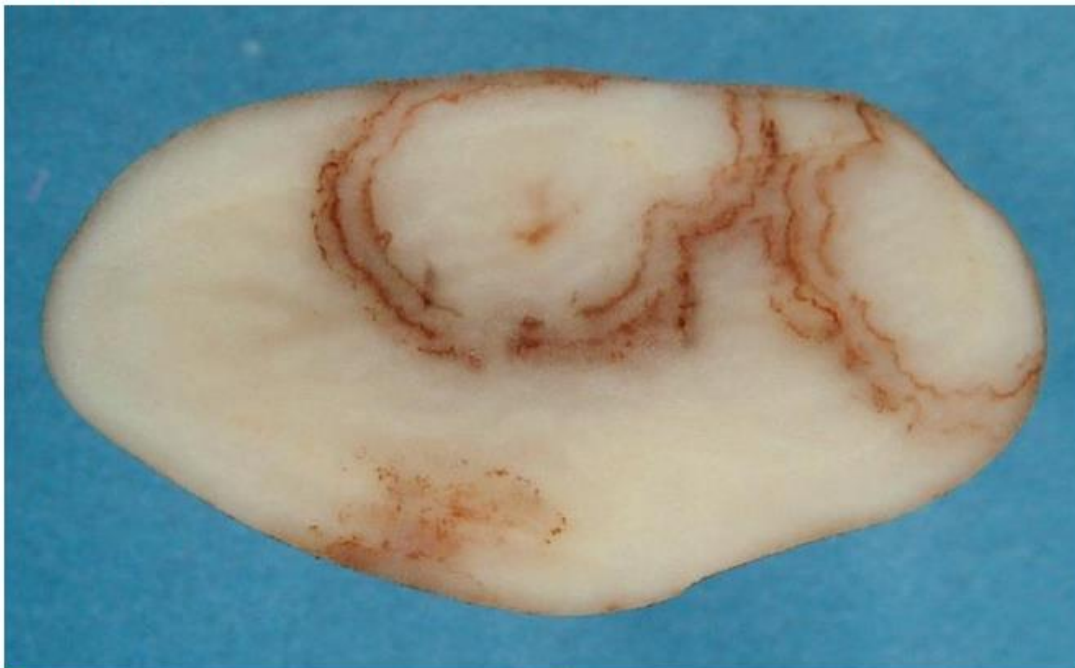
Spraing caused by MPTV