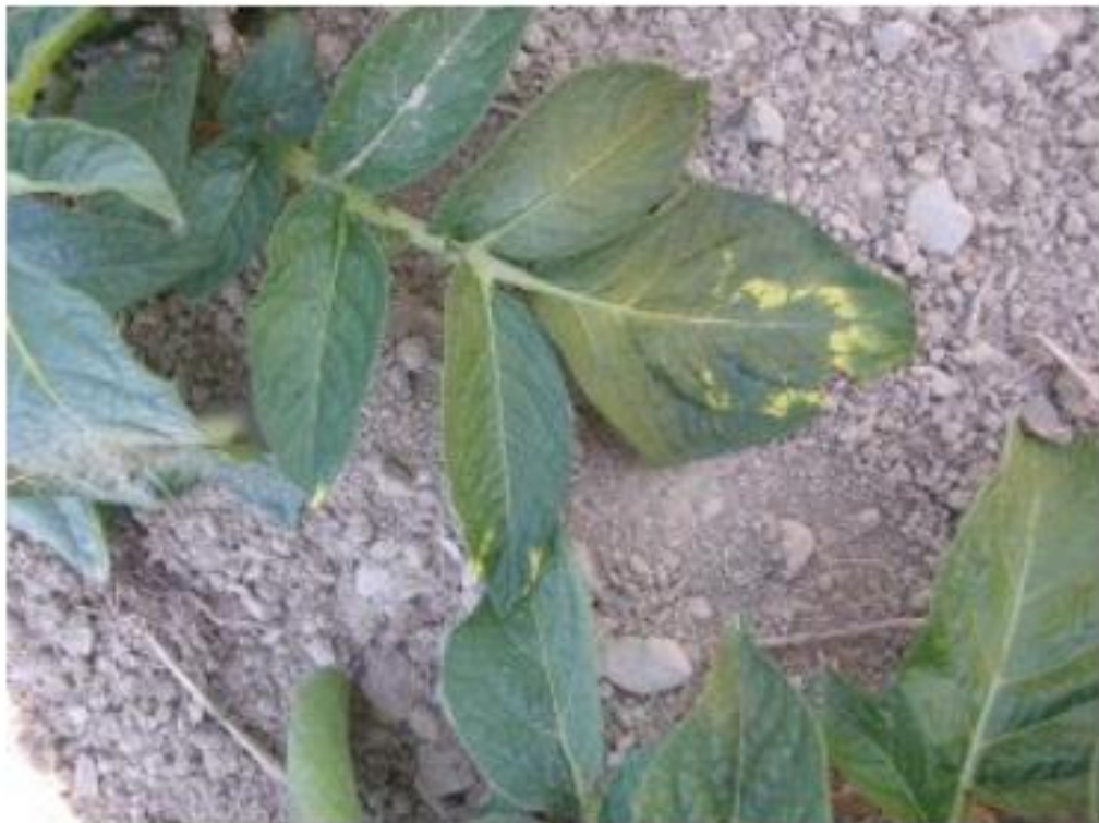
Foliage symptoms showing chevron or V pattern of mop-top virus on potato plant.