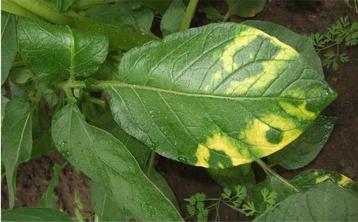
Observed symptom Potato mop-top virus described by Inra (Ephytia): Bright yellow arcs or rings on the bottom potato leaves of some cultivars infected with PMTV